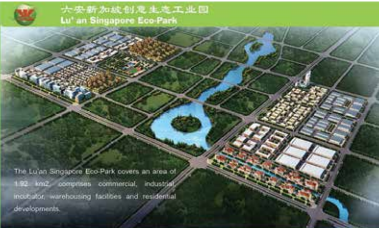
六安新加坡创意生态工业园（Lu' an Singapore Eco-Park）